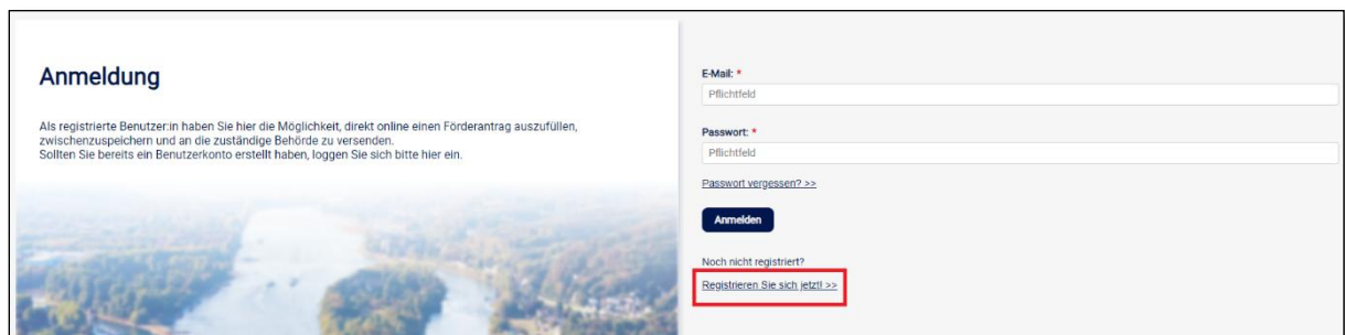
Abb. 2: Registrierung

Nach Klick auf „Für Privatpersonen“, „Für Kommunen“ oder „Für Organisationen, Unternehmen und Vereine“ haben Sie nun die Möglichkeit sich zu registrieren: